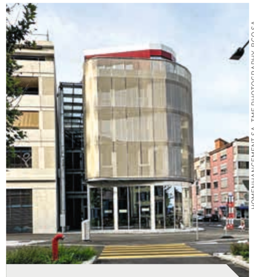
HOMENANCEMENT SA, TIME PHOTOGRAPHY, BCO SA