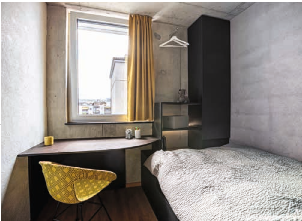
HOMENHANCEMENT SA, BCO SA

La façade latérale est, quant à elle, habillée de tôles d'aluminium anodisé. Le matériau, durable et facile à entretenir, donne un éclat unique à la façade. Le jeu tridimensionnel des caissons lui confère un rythme original.